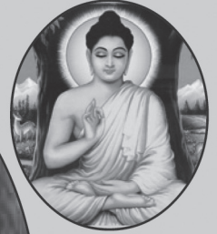
బుద్ధ జయంతి వైశాఖ పూర్ణిమ 18-05-2019