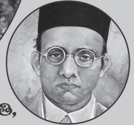
స్వాతంత్ర్యవీర సారవాలీ జయంతి 28 మే 2019

ఆవిశంకరాచార్య జయంతి, వైశాఖ శు. పంచమి 2019 మే 9