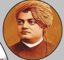
స్వామి వివేకానంద జయంతి జనవరి 12