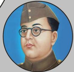
నేతాజీ జయంతి జనవరి 23