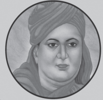
దయానంద సరోజితీ జయంతి రథసప్తమి 12-02-2019