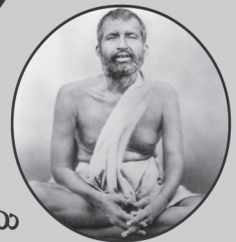
రామకృష్ణ పరమహంస జయంతి మాఘ బహుళ నవమి 28-02-2019